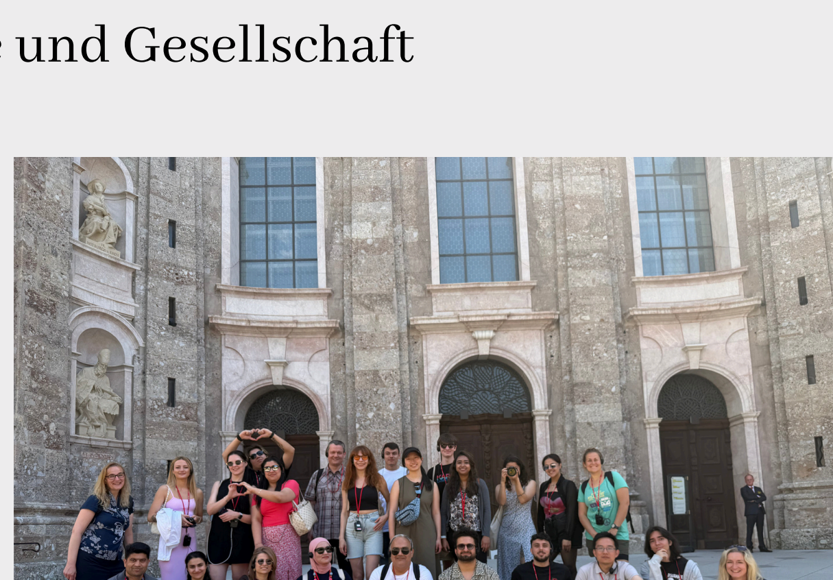
Erasmus+ Ausflug nach Innsbruck 24.05.2026